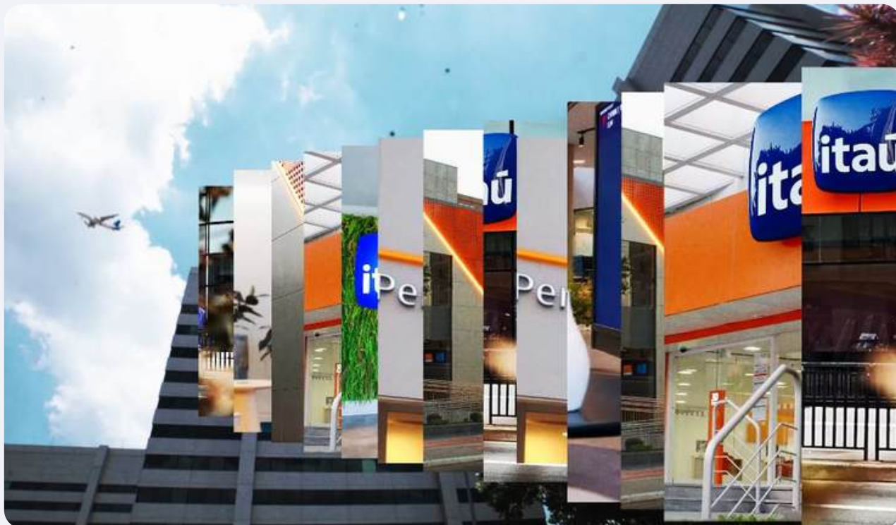
Manifesto Varejo - youtube.com/@ePlayVideos

Já os manifestos expressam a essência de uma marca de forma emocional, apaixonada e inspiradora. É a ferramenta perfeita para comunicar a missão e os princípios fundamentais da empresa, criando uma forte conexão com o público.