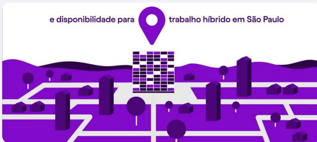
Nubank - Programa de Estágio 2024 ( youtube.com/@ePlayVideos )

Por fim, vídeos explicativos em motion unem animações dinâmicas e explicações visuais para tornar conceitos e processos mais acessíveis e fáceis de entender, sendo ideais para descomplicar informações, fortalecer a comunicação interna e externa.