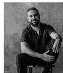
Eduardo Vieira Fotógrafo

Fotos para LinkedIn, Publicidade, Social Media, Moda, Imprensa, Divulgação.