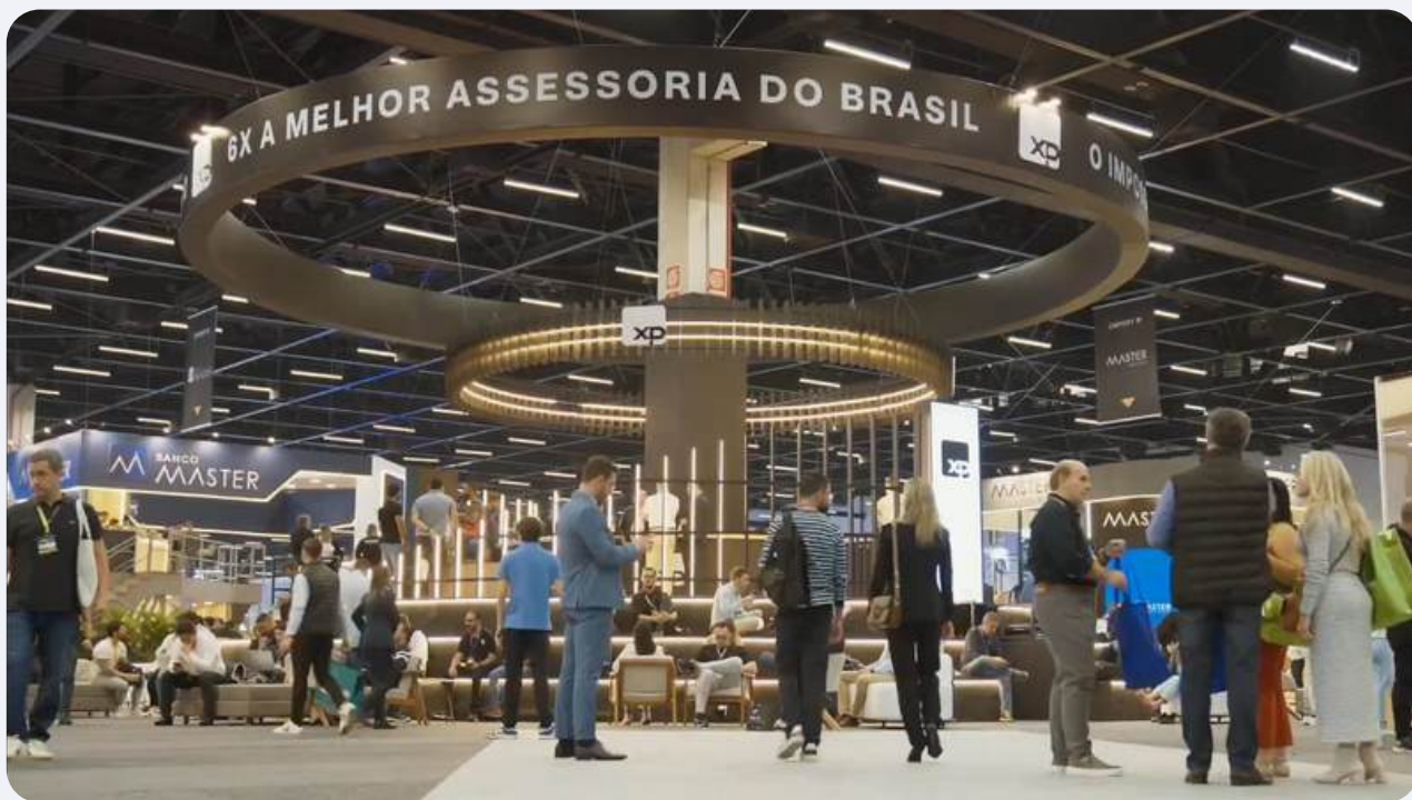
XP Inc. - Expert 2024 - ( youtube.com/@ePlayVideos )

A cobertura de eventos transforma momentos importantes em conteúdo, ampliando o alcance e engajamento com o público, mesmo para quem não pôde estar presente.