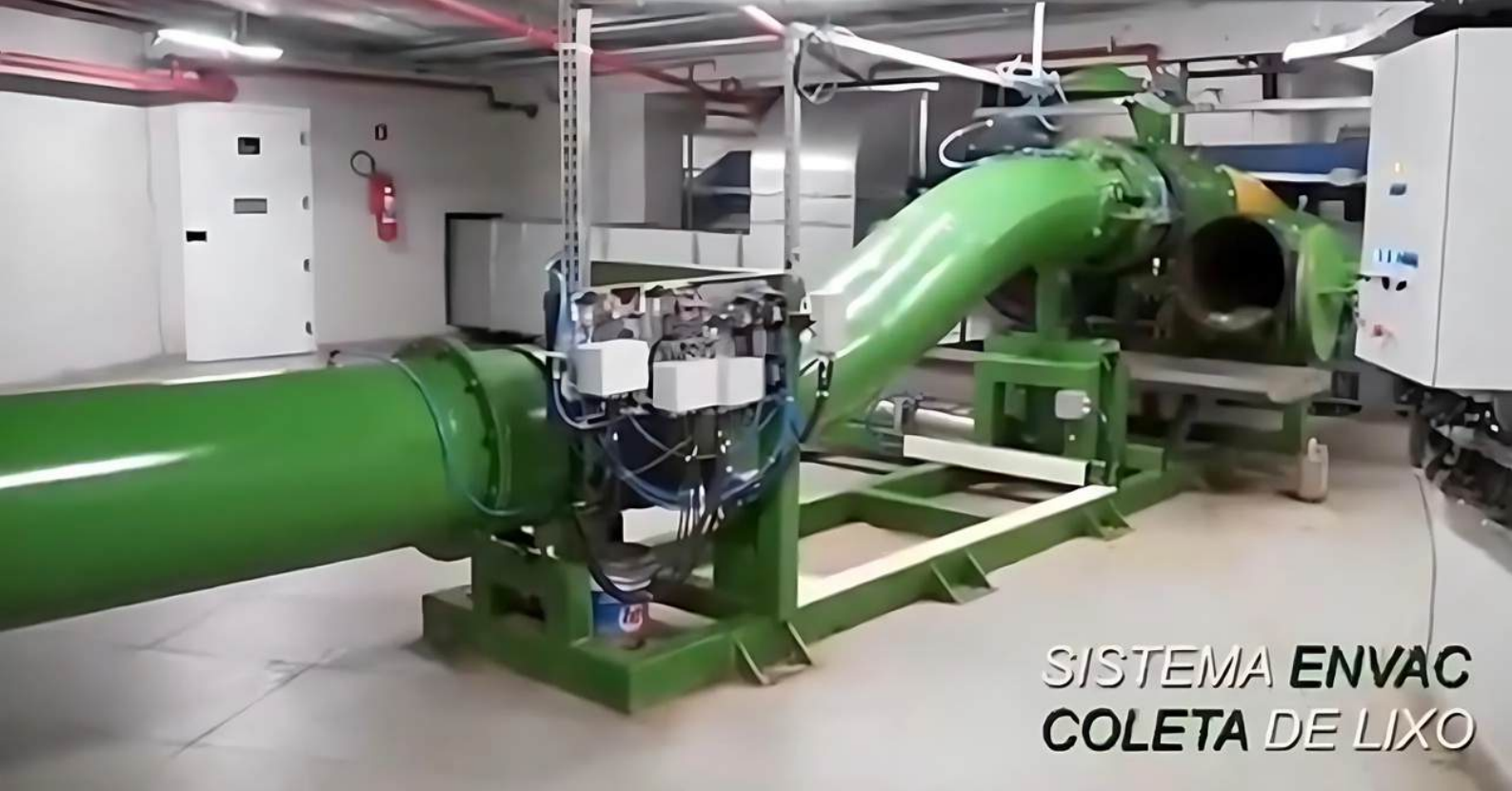
SISTEMA ENVAC COLETA DE LIXO